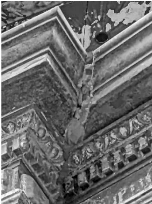
Spaltmaßfehler am Kanzelkorb

Nach vielen Jahren des Stillstandes geht es nun endlich weiter: Die Lucht-Kanzel in St. Jakobi ist seit dem 18. März eingerüstet und wird zunächst teilweise zurückgebaut, um sie dann mit den (hoffentlich) korrekten Maßen wieder zusammzusetzen. Hintergrund ist, dass bestimmte noch vorhandene Originalteile dieses in den dreißiger Jahren als „schönste Kanzel Pommerns“ bezeichneten Bauwerks noch vorhanden sind, aber leider nicht mehr „ranpassen“. So existieren noch Wangenteile der Aufstiegstreppe, größere Teile des Eingangsportals sowie Holzschnitzereien, die unterhalb des Kanzelkorbes angebracht werden sollen. Alles wertvolle Arbeiten, die bislang im Depot liegen mussten. Die Rekonstruktion der Lucht-Kanzel ist ein überaus komplexes Unterfangen, da sie vor dem Krieg demontiert und (z.T.) falsch eingelagert wurde. Holzteile haben sich durch Feuchtigkeit verzogen, Steinmetzarbeiten sind beschädigt usw. Zeichnungen und Fotos sollen helfen, die Kanzel wieder soweit wie möglich mit den Originalteilen wieder aufzubauen. Es ist noch etwas unklar, wo genau der oder die Fehler bei der Anfang der zweitausender Jahre durchgeführten ersten Sanierungsphase gelegen haben können. Aktuell werden von den Restauratoren daher umfangreiche Messungen und Bestandsaufnahmen vorgenommen, bevor dann die Demontage des Kanzelkorbes erfolgen kann.