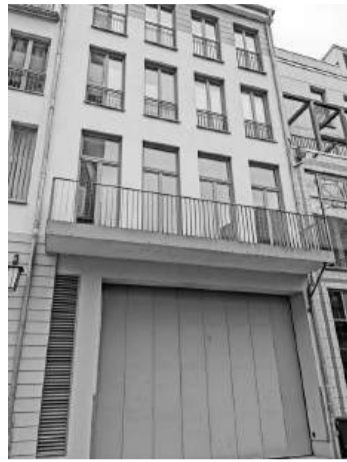
Badenstraße 5 - Abriss und Neubau

an 2 Stellen Feuer gelegt wurde. Der Eigentümer Heinz Nupnau, der das Haus ca. 1994 erworben hatte, befand sich nicht nur im Streit mit der Denkmalpflege, die u. a. die Restaurierung des Treppenhauses gefordert hatte. Dicke Luft gab es auch mit der Bauaufsicht, die die Sicherung des baufäl-